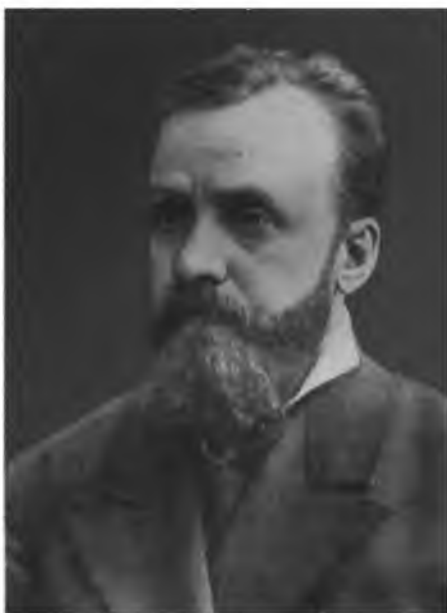
Г. И. Успенский.