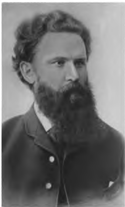
В. Г. Короленко.