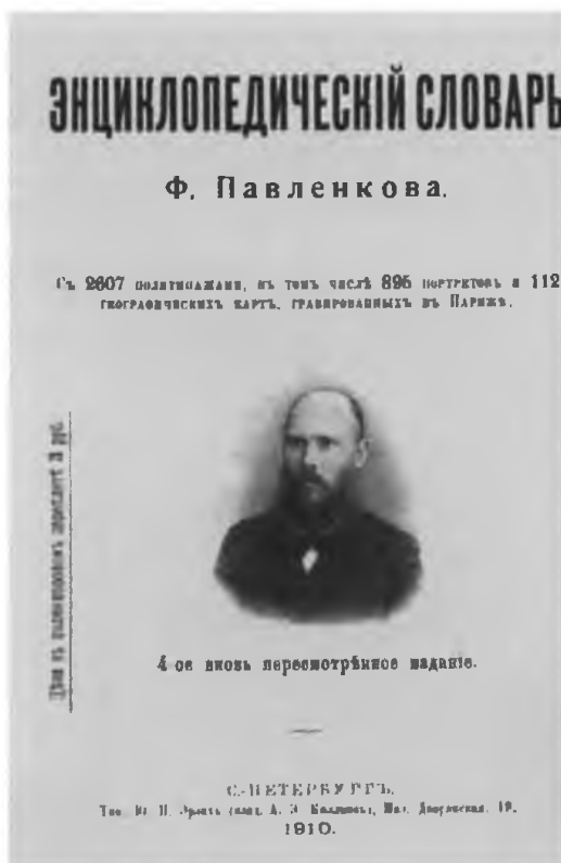
«Энциклопедический словарь» Ф. Павленкова.