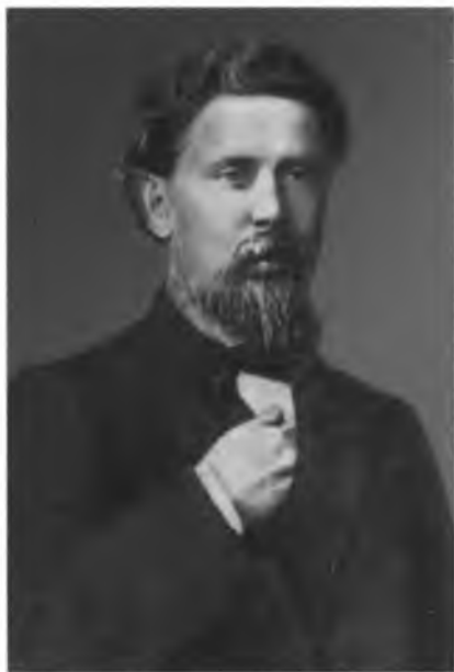
А. М. Скабичевский.