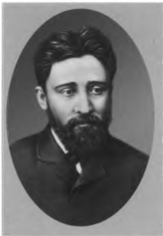
В. М. Гаршин.