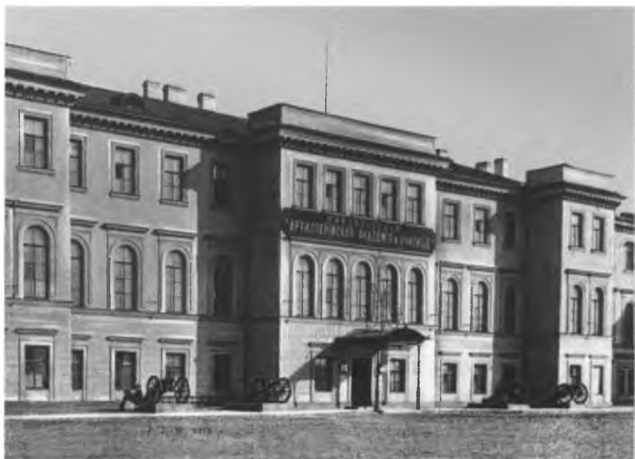
Михайловская артиллерийская академия. Петербург.