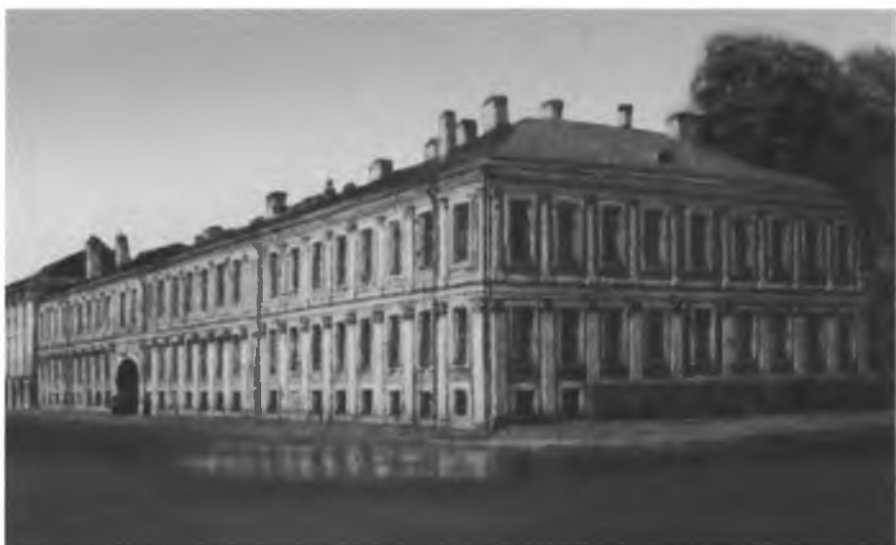
1-й кадетский корпус, где учился Флорентий Павленков. Петербург.