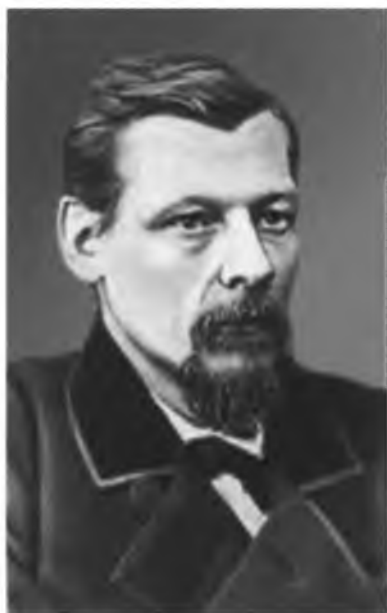
Н. В. Шелгунов.