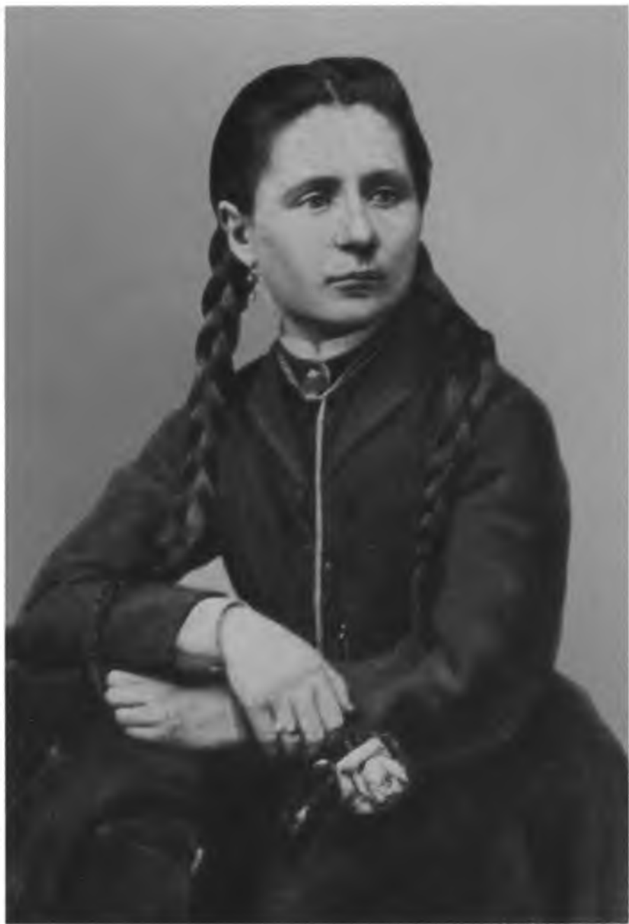
В. И. Писарева. 1860-е гг.