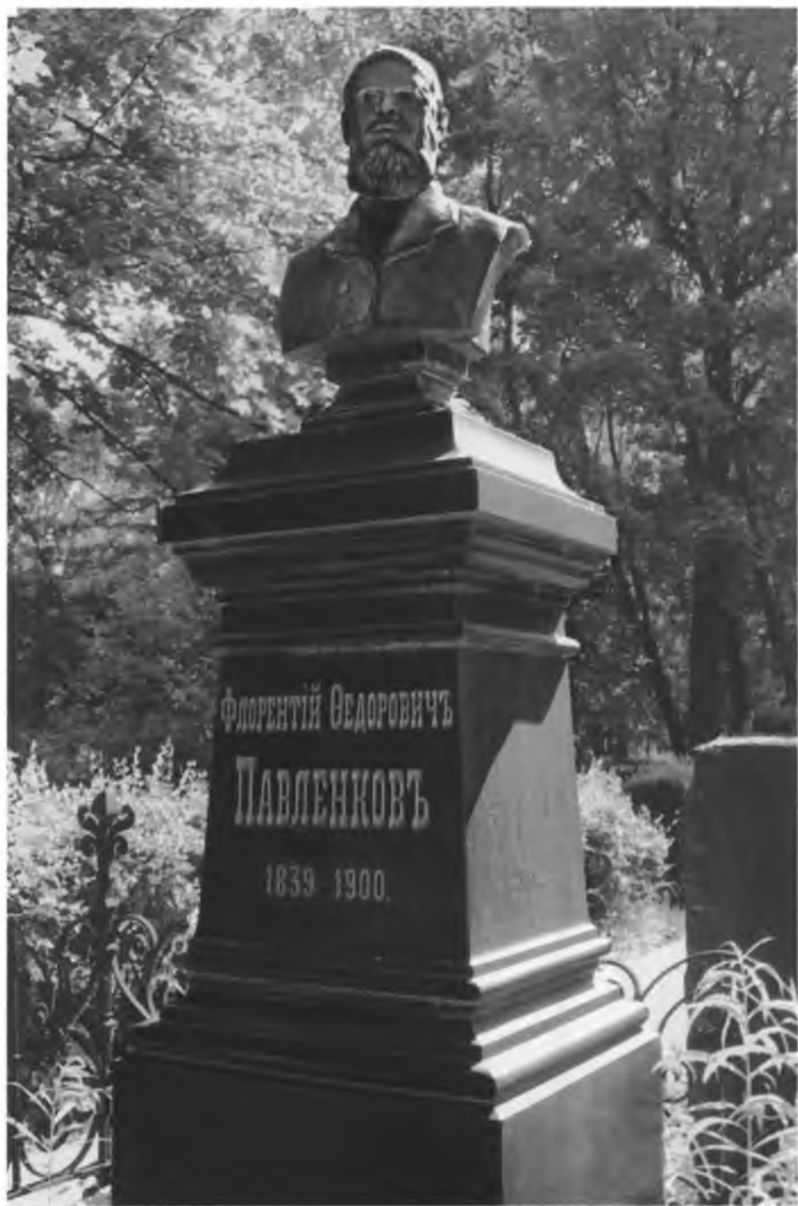
Памятник Ф. Ф. Павленкову на Волковом кладбище.