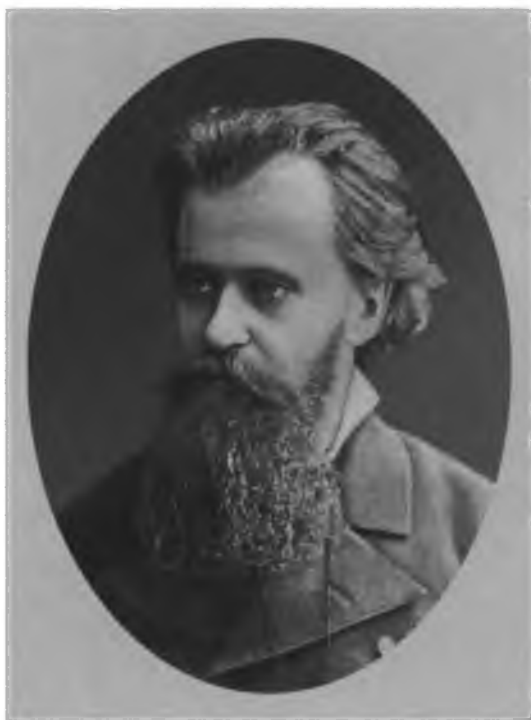
Н. К. Михайловский.