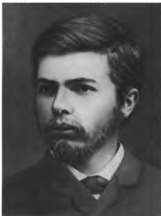
Н. А. Рубакин.